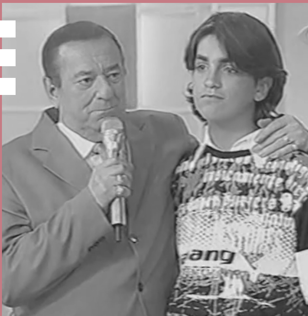
"JOVENS TALENTOS"- PROGRAMA RAUL GIL (2005)